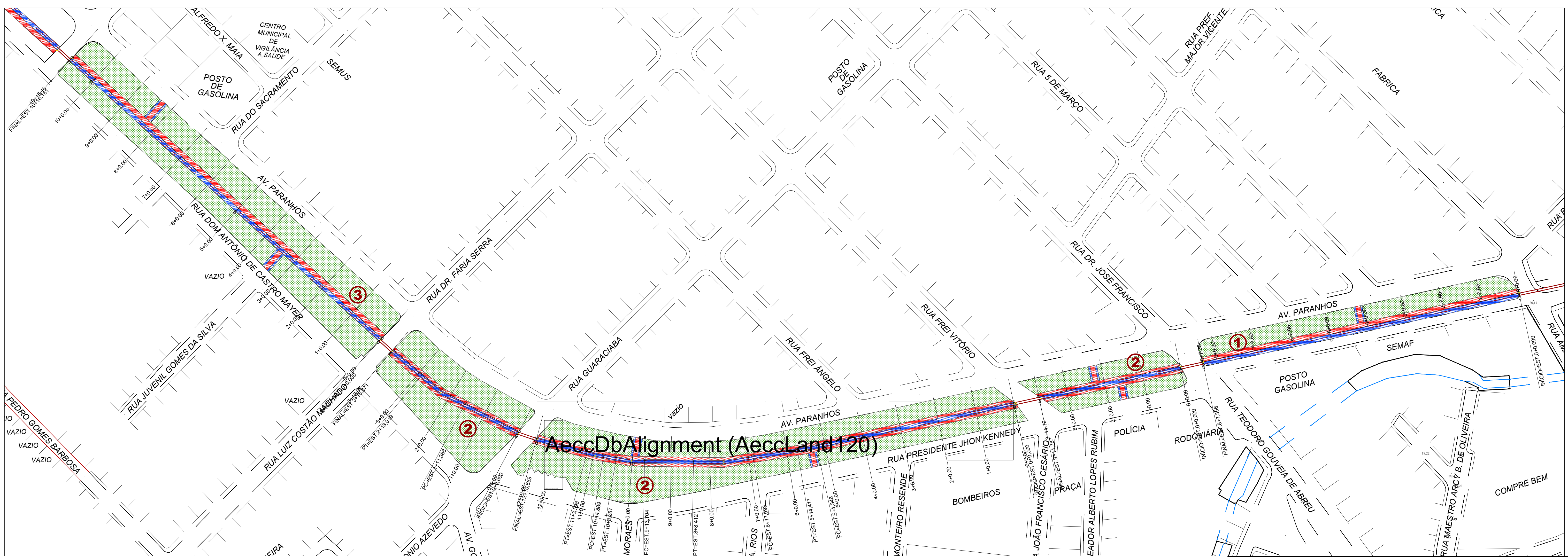
1 LEVANTAMENTO PLANIALTIMETRICO esc.: 1/1000